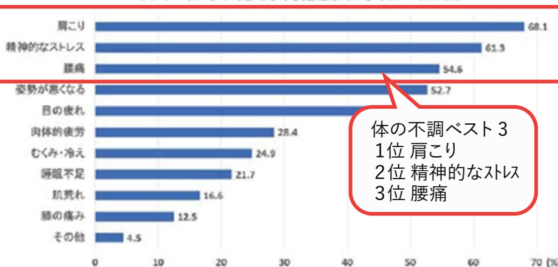
テレワークによってどんな不調を感じていますか？(n=313)