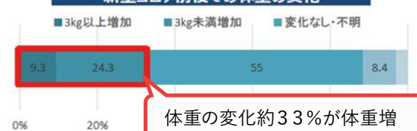
新型コロナ前後での体重の変化